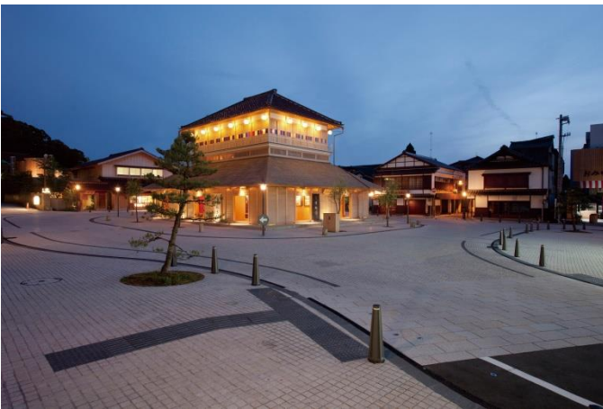
山代温泉総湯 (イメージ)