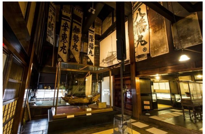
北前船主の館 右近家 南越前町 (イメージ)