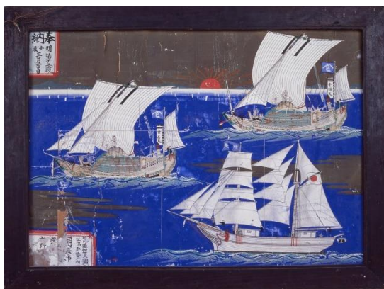
船絵馬 幸徳丸・幸甚丸・卯日丸

大会テーマ 能登半島地震からの北陸復興に向けて 北陸新幹線延伸開業を契機に北前船文化を世界へ発信